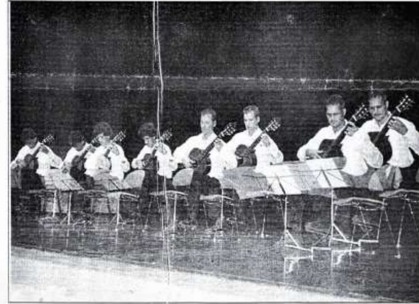
Effets sonores, effets visuels... Quand le talent voit double.

Les mousquetaires eux aussi étaient quatre : Claude Delrieu, Serge Di Mosole, Christophe